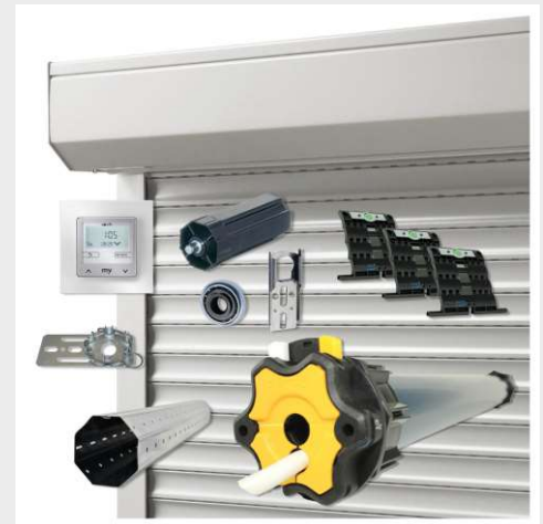
Umrüstung von Rollläden auf Motorantrieb für mehr Komfort und Einbruchschutz.